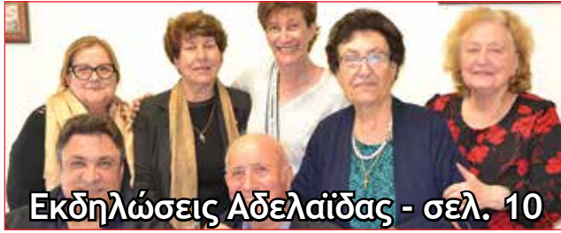
Εκδηλώσεις Αδελαιδας - σελ. 10

ΕΛΛΑΔΑ Καμπανάκι κινδύνου για την λειψυδρία Σελίδα 5