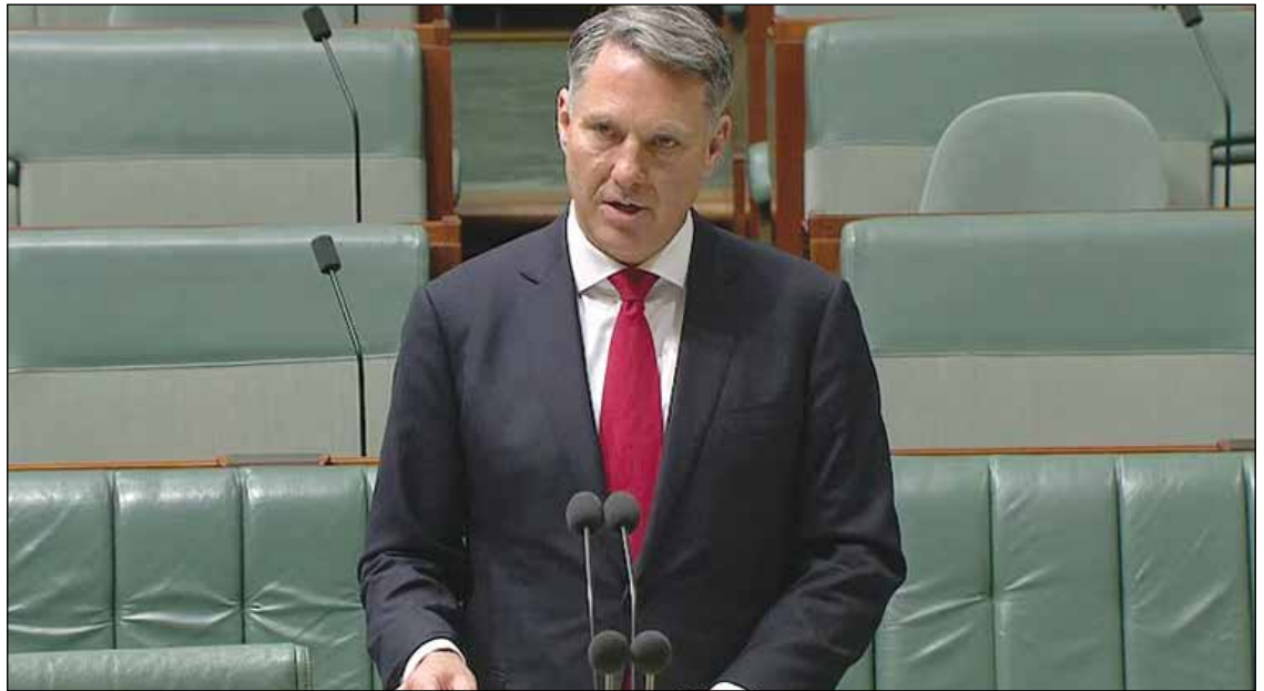
Ο Υπουργός Άμυνας Ρίτσαρντ Μαρλς προχώρησε στην αφαίρεση μεταλλίων από στρατιωτικούς

Ο Μαρλς αποφάσισε να ανακαλέσει τα βραβεία καθώς προχώρησε για να οριστικοποιήσει την απάντηση της κυβέρνησης στα εκρηκτικά ευρήματα της έρευνας του Μπρέρετον για τα φερόμενα