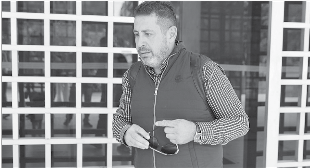
Ο πατέρας του 19χρονου που έχασε άδικα τη ζωή του σε λούνα παρκ στην Χαλκιδική

«Το παλικάρι μου, που ήταν δύο μέτρα κούκλος και ένα από τα καλύτερα παιδιά από ό,τι μαθαίνω