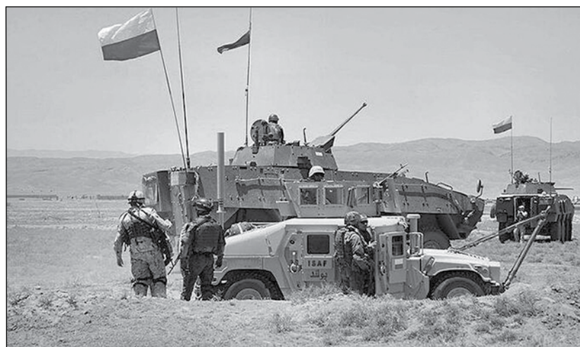
ΠΟΛΩΝΙΑ: Υψώνει ασπίδα στα σύνορα με Ρωσία και Λευκορωσία

«Φανταστείτε πως δεν υπάρχει ρεύμα στην πρίζα ή νερό στη βρύση. Το ψυγείο και ο φούρνος δεν λειτουργούν. Ίσως να μην μπορείτε να πάτε για ψώνια, να τηλεφωνήσετε ή να συνδεθείτε στο διαδίκτυο», προειδοποιούν οι δανέζικες αρχές και παραθέτουν λεπτομερείς οδηγίες για να μπορούν τα νοικοκυριά να επιβιώ-