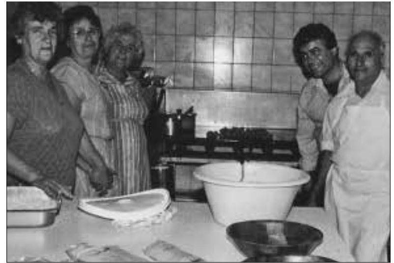
Εθελοντές της Ικαριακής Αδελφότητας σε ώρα εργασίας στην κουζίνα του χωλ για εκδήλωση του συλλόγου