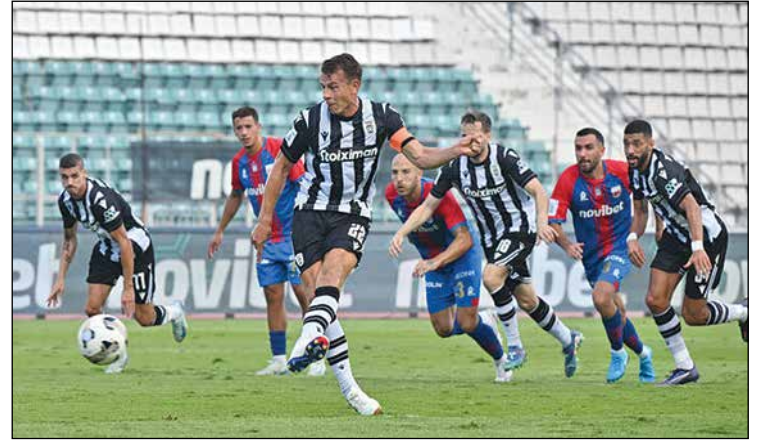
Από τον αγώνα του ΠΑΟΚ με τον Βόλο 4-1

Στους άλλους αγώνες ο Παναθηναϊκός νίκησε 3-1