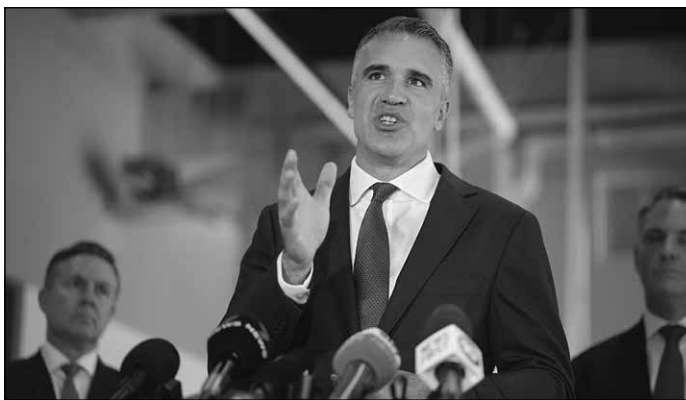
Ο Πρέμιερ της Νότιας Αυστραλίας Πήτερ Μαλιναύσκας

Στο Εθνικό Υπουργικό Συμβούλιο την Παρασκευή, ο Πρωθυπουργός Peter Mali-