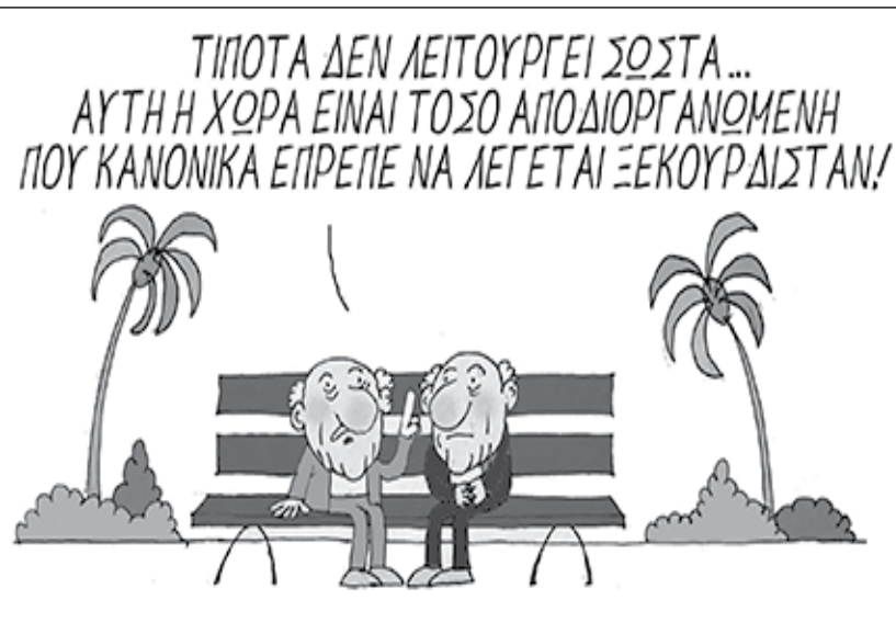
Η γελοιογραφία του Γιώργου Μητίδη